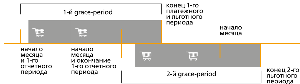
Схема льготного периода

Отчетный период — это период, в течение которого держатель карты совершает покупки. По истечении отчетного периода банк определяет сумму задолженности.